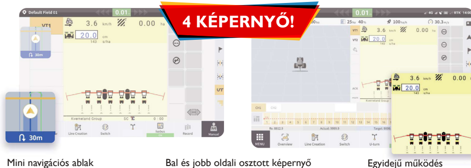
Mini navigációs ablak

A négyképernyős elrendezés lehetővé teszi több adatablak egyidejű megjelenítését.